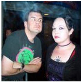
Ed & Me