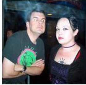
Ed & Me