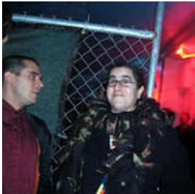
squirrel and jean