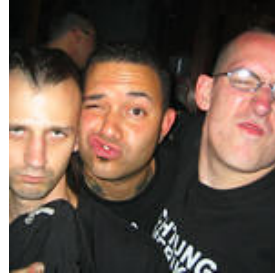
goblyn rich rabbit